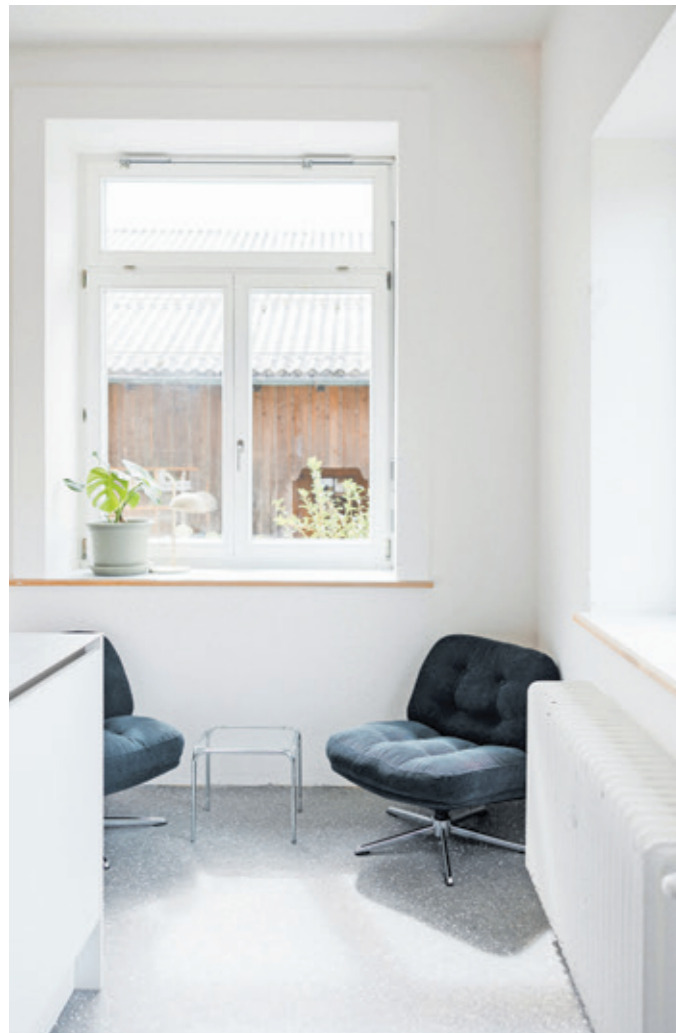
Auch der einzige neue Boden in der Küche, jetzt ein geschliffener Estrich, wurde an den angrenzenden Gangboden angepasst.