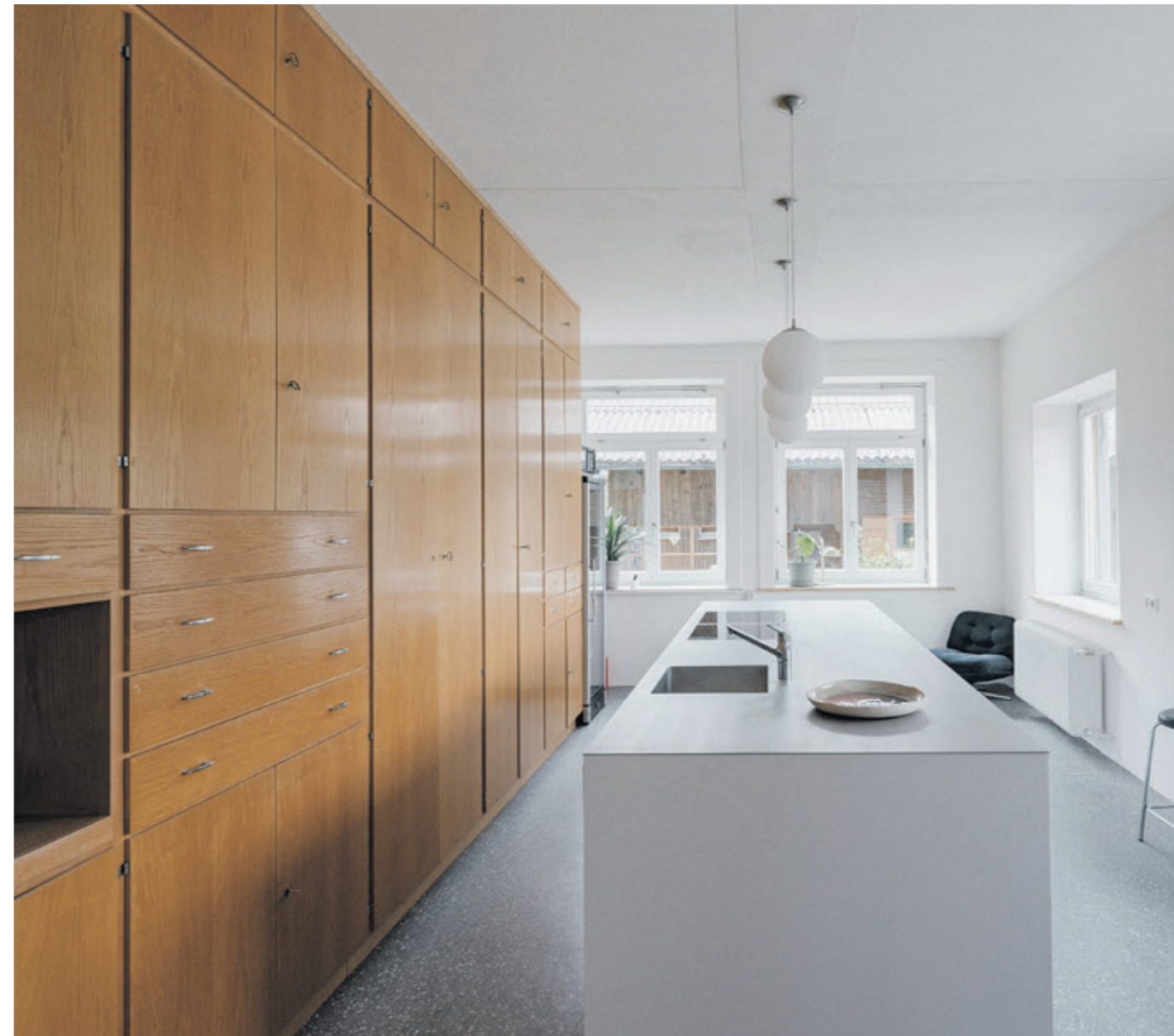
Alte Bauelemente wurden ins neue Gebäude integriert, um Kontinuität zu zeigen. Für die neue Küche wurden zwei Räume zusammengelegt, eine Wand entfernt und die alten Lehrerzimmerkästen behutsam angepasst und wieder eingebaut.