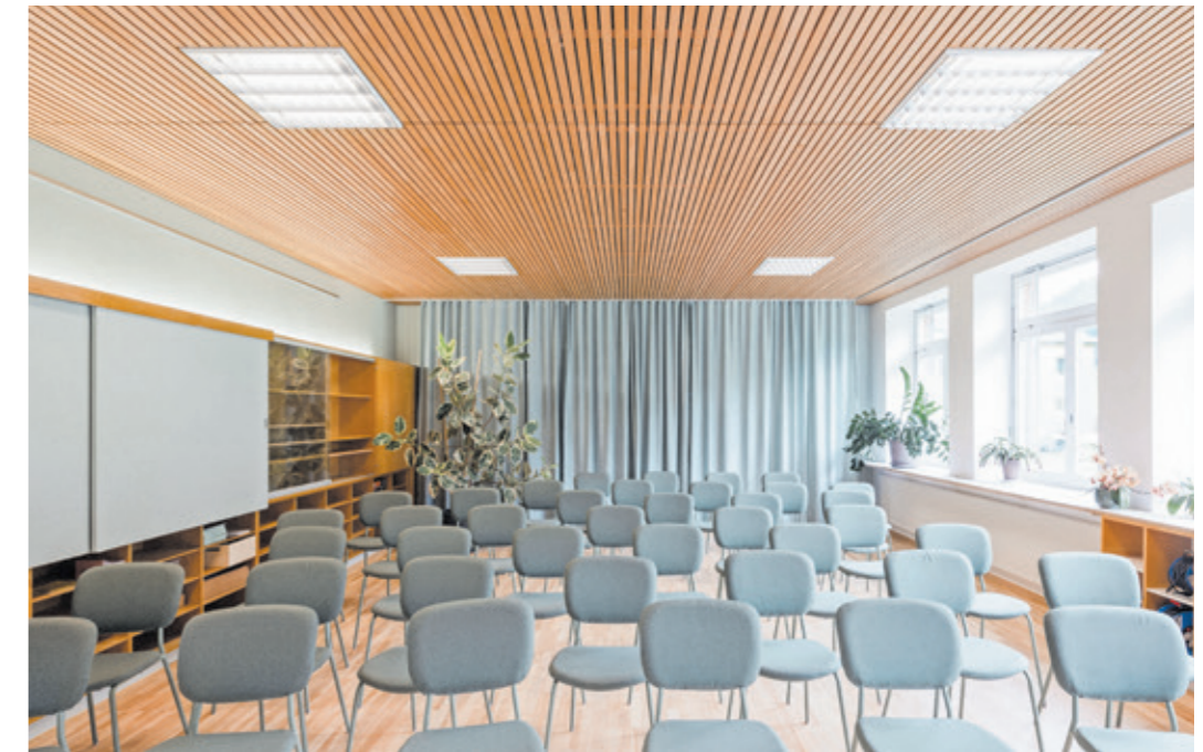
Aus dem früheren Klassenzimmer wurde ein Ort des Austauschs, der Ruhe und der Gemeinschaft, die Möbel stammen von CASA Möbel in Hohenems.

tität des Ortes. Doch ein Haus ist nur so stark wie das Leben, das es beherbergt. Die Gute Stube verfolgt einen klaren sozialpädagogischen Anspruch. Sie möchte Jugendlichen zwischen 12 und 18 Jahren einen Ort geben, an dem sie ernst genommen werden – ohne Leistungsdruck, ohne Konsumzwang, ohne Erwartung, etwas „sein zu müssen“. Ziel ist es, Räume für Selbstentfaltung und Gemeinschaft zu schaffen. Junge Menschen können hier einfach ankommen, reden, spielen, Musik machen, Unterstützung suchen oder sich zurückziehen. Gleichzeitig versteht sich die Gute Stube als generationsübergreifende Brücke zwischen Gemeinde und Jugend: Ein Ort, an dem junge Menschen sichtbar werden und ihre Anliegen Gewicht bekommen. Zudem setzt die Jugendarbeit bewusst auf Beteiligung. Jugendliche gestalten Teile der Räume selbst, entscheiden über Angebote mit und können Projekte initiieren, die ihnen wichtig sind. Damit wird das Schulhaus, das früher ein Ort der Belehrung war, zu einem Ort der Mitgestaltung.