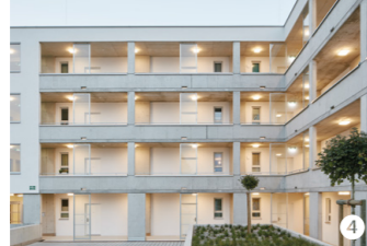
Wohnbebauung Sternäckerweg, Graz ARGE balloon_gaft&onion

④ Wohnbebauung Sternäckerweg, ARGE balloon_gaft&onion 25. Mai, 12–13 Uhr Sternäckerweg 51, Graz balloon-rgw.at