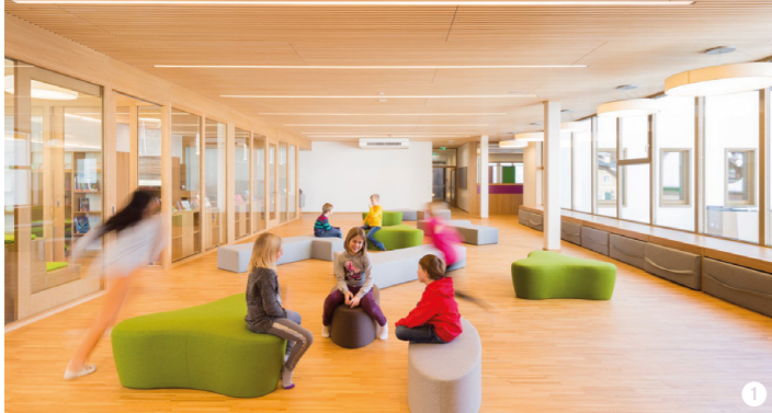
Kindergarten Bunte Perlen, Bad Aussee, Rodlauer Greimeister ZT GmbH