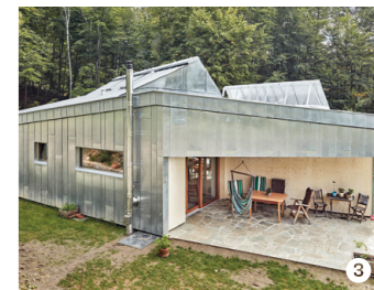
Haus HGW – Einfamilienwohnhaus in Holz- und Strohbauweise, Stattegg, pluspunkt architektur

Im ehemaligen Industriegebiet rund um die Helmut List Halle im Grazer Westen entsteht seit einigen Jahren nach den Smart City-Strategien der Stadt Graz ein neuer Stadtteil. Neben dem markanten Science Tower (Markus Pernthaler Architekten) wurden inzwischen weitere Gebäude im Projektgebiet errichtet. Was ist wo geplant und wie soll es dort in fünf Jahren aussehen? → Rundgang mit dem Stadtteilmanagement vor.ort (ein Projekt der StadtLABOR GmbH)